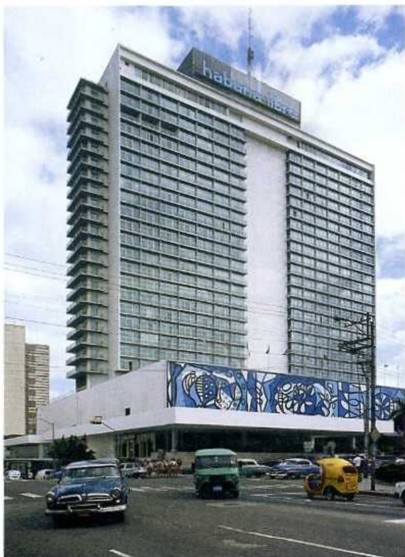
Coliseo de la Ciudad Deportiva, der Sportpalast im Sportpark, 1955–1957. Architekten Nicolás Arroyo und Gabriela Menéndez. Habana Hilton/Habana Libre, 1958. Architekten Welton Becket Ass.

entstehen in den ersten Jahren nach dem Sieg der Revolution einige bemerkenswerte Bauten. Die unbestreitbar herausragenden Beispiele dieser Zeit sind die Unidad 1 de La Habana del Este und die Ciudad Universitaria José Antonio Echeverría.