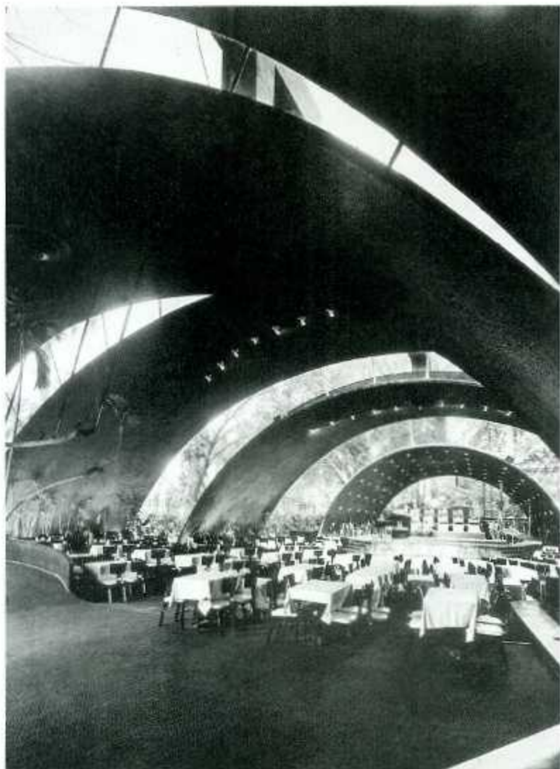
Casa Ana Carolina Font, 1956, Architekt Mario Romañach. Nachtclub und Cabaret Tropicana, erster Bauabschnitt war der Salon „Arcos de Cristal“, 1951, Architekt Max Borges.

lenstein bei der Suche nach der Integration der architektonischen Avantgarde in den tropischen Kontext. Bedauerlicherweise verhindert die aktuelle Nutzung des Gebäudes als Regierungsgästehaus sowohl Besichtigungen als auch tiefer gehende Studien zu seiner Architektur.