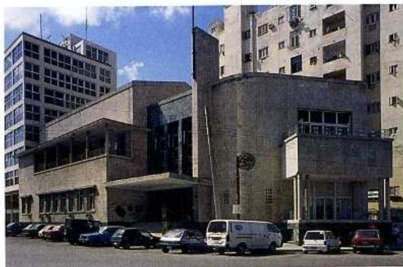
Apartmenthaus Solimar, 1944, Architekt Manuel Copada, ein Leuch- turm des Expressionismus. Haus der Architektenkammer, 1947, Architekten Fernando de Zárraga und Mario Esquiróz.

Sein eigenes Haus entwarf Max Borges zwischen 1948 und 1950. Es handelt sich hierbei um einen Quader auf schlanken Metallstützen,